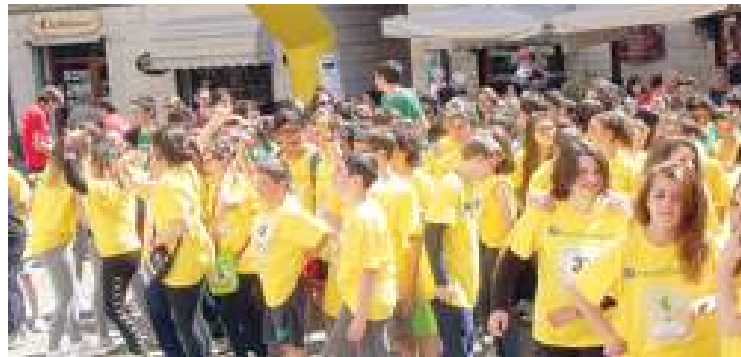
Una delle manifestazioni di Legambiente

Al bosco dei frati di Nostra Signora del Monte, ai forti, da quelli di levante a quelli di ponente a quelli più conosciuti, e anche sull'antico acquedotto. Durante ogni escursione descriviamo l'ambiente circostante, dal punto di vista botanico e faunistico, parliamo di fossili e geologia, ma diamo an-